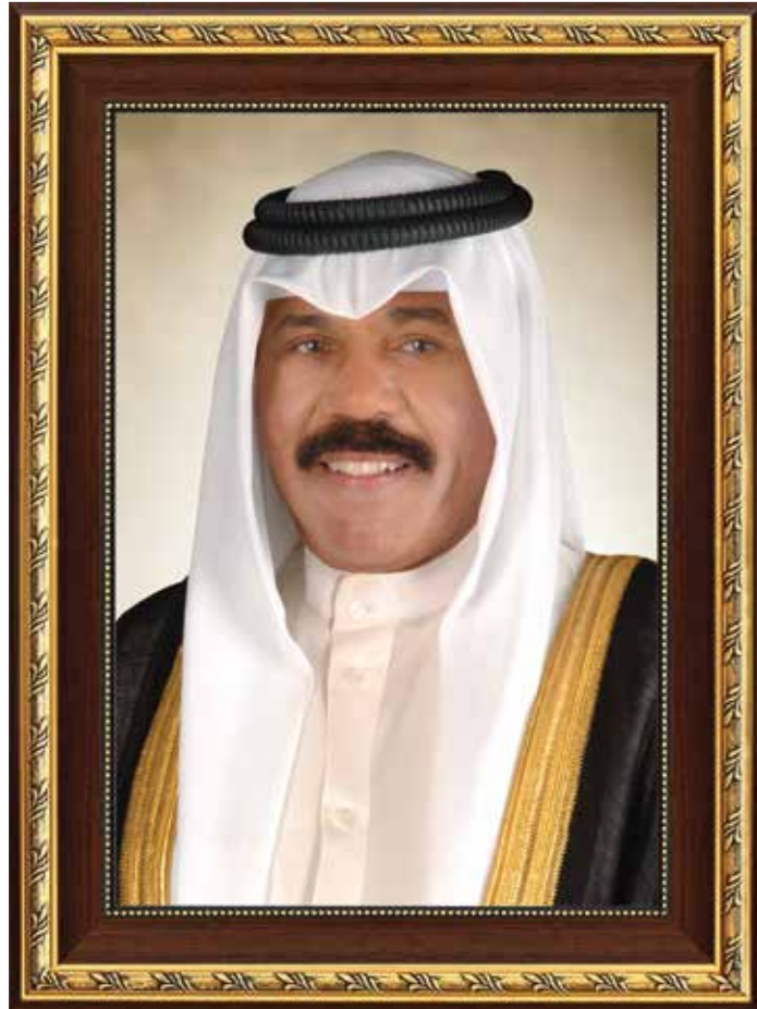
حضرة صاحب السمو الشيخ نواف الأحمد الجابر الصباح أمير دولة الكويت

H.H. Sheikh Nawaf AL-Ahmad Al-Jaber Al-Sabah The Amir Of The State Of Kuwait