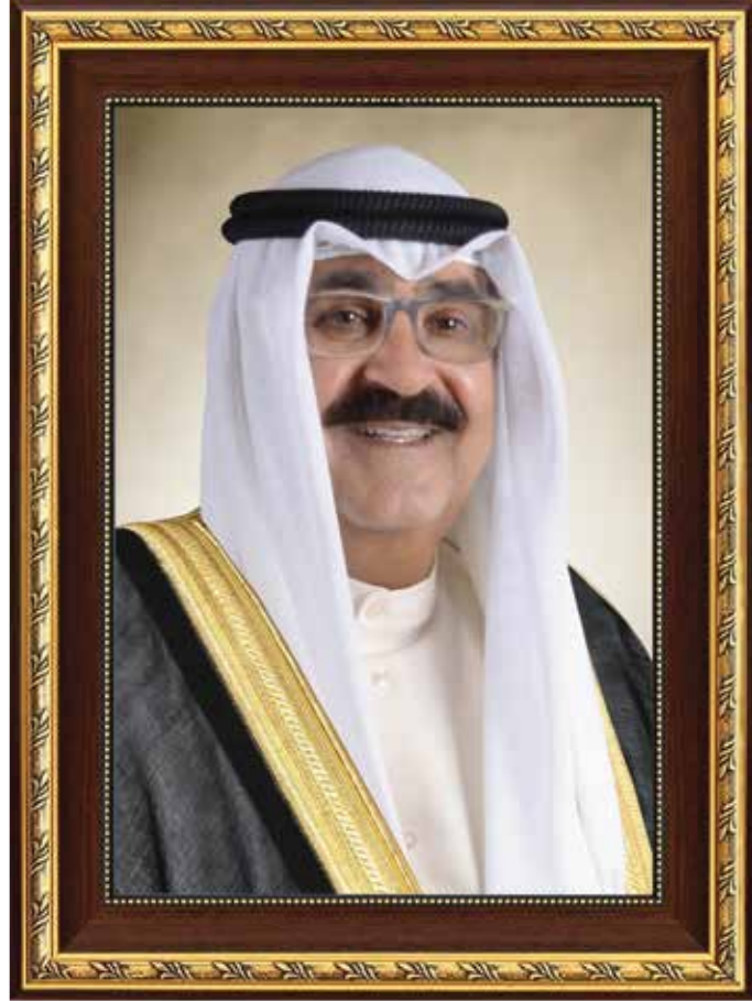
سمو الشيخ مشعل الأحمد الجابر الصباح ولي عهد دولة الكويت

H.H. Sheikh Meshal AL-Ahmad Al-Jaber Al-Sabah The Crown Prince Of The State Of Kuwait