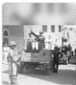
حركة الاستعمار الاوروبى

رتب الصور التى أمامك طبقاً للأحداث من الأقدم إلى الأحدث.