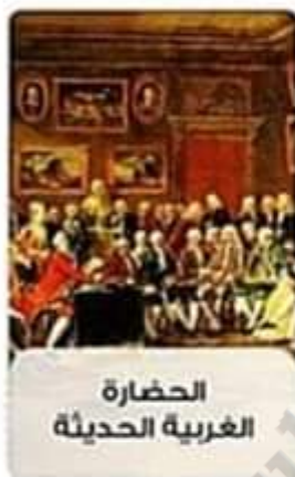
الحضارة الغربية الحديثة