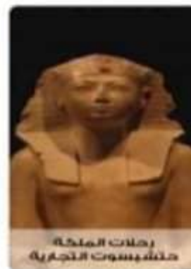
رحلات الملكة حتشبسوت التجارية