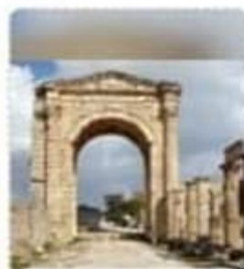
قيام حضارة فيليقيا