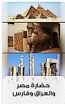
حضارة مصر والعراق وفارس

انظر إلى الصور التي أمامك ورتب الحضارات طبقاً لظهورها من الأقدم إلى الأحدث.