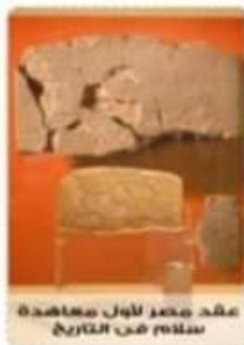
عقد مصر لأول معاهدة سلام في التاريخ