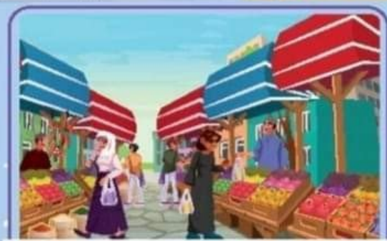
١- السوق مليء بالفواكة والخضروات

الأهداف * نشاط ٣ (د): يتعرّف الموقّع الإغرابيّ والعلامة الصحيحة. * نشاط ٣ (هـ): يُكمل ما هو مطلوب منه، مُراعياً الإكمال الصحيح. * نشاط ٣ (و): يتّكّن من تصويب الخطأ، مبينًا السبب. * نشاط ٣ (ز): يُعبّر عن الصور مُستخدماً الجمل الاسميّة استخدماً صحيحاً.