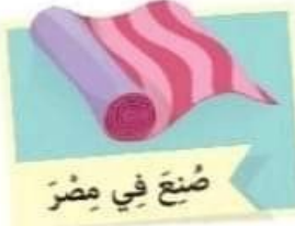
صُنِعَ فِي مِصْرَ