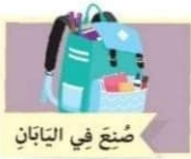
صُنِعَ فِي الْيَابَانِ

١- فَكِّرْ: نَشَاطٌ: أَمَامَكَ صُورٌ لِمَجْمُوعَةٍ مِنَ الْمُنْتَجَاتِ، انظُرْ إِلَيْهَا ثُمَّ صَنَّفْهَا لِمَجْمُوعَتَيْنِ: