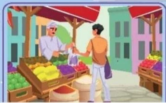
٢- فواكة البائع منسقة.