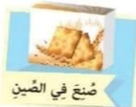
صُنِعَ فِي الصِّينِ