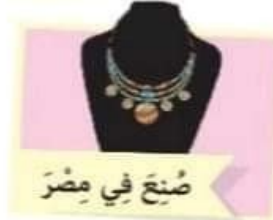
صُنِعَ فِي مِصْرَ

(أ) هَلْ صَنَّفْتَ هَذِهِ الْمُنْتَجَاتِ؟ مَا الْأَسَاسُ الَّذِي بَنَيْتَ عَلَيْهِ هَذَا التَّصْنِيفَ؟