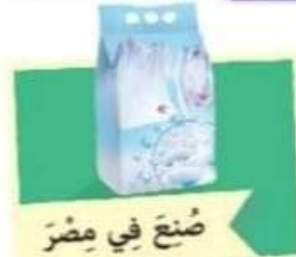
صُنِعَ فِي مِصْرَ