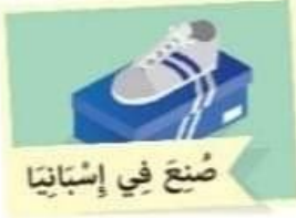
صُنِعَ فِي إِسبَانِيَا