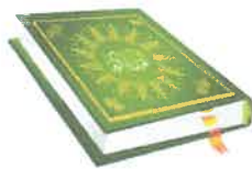
محمد صلى الله عليه وسلم ص ١١٢

ج - اكتب اسم النبي عند صورة المعجزة المناسبة فيما يأتي: