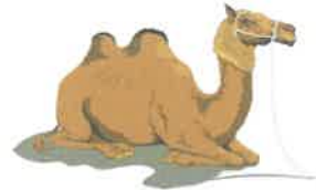
صالح عليه السلام ص ١٠٥