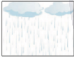
عند نزول المطر

سؤال: اكتب اوقات الاستجابة التي تشير إليها تلك الصور: