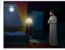
الثالث الاخير من الليل