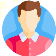
استاذ ثالث متوسط @stad3m