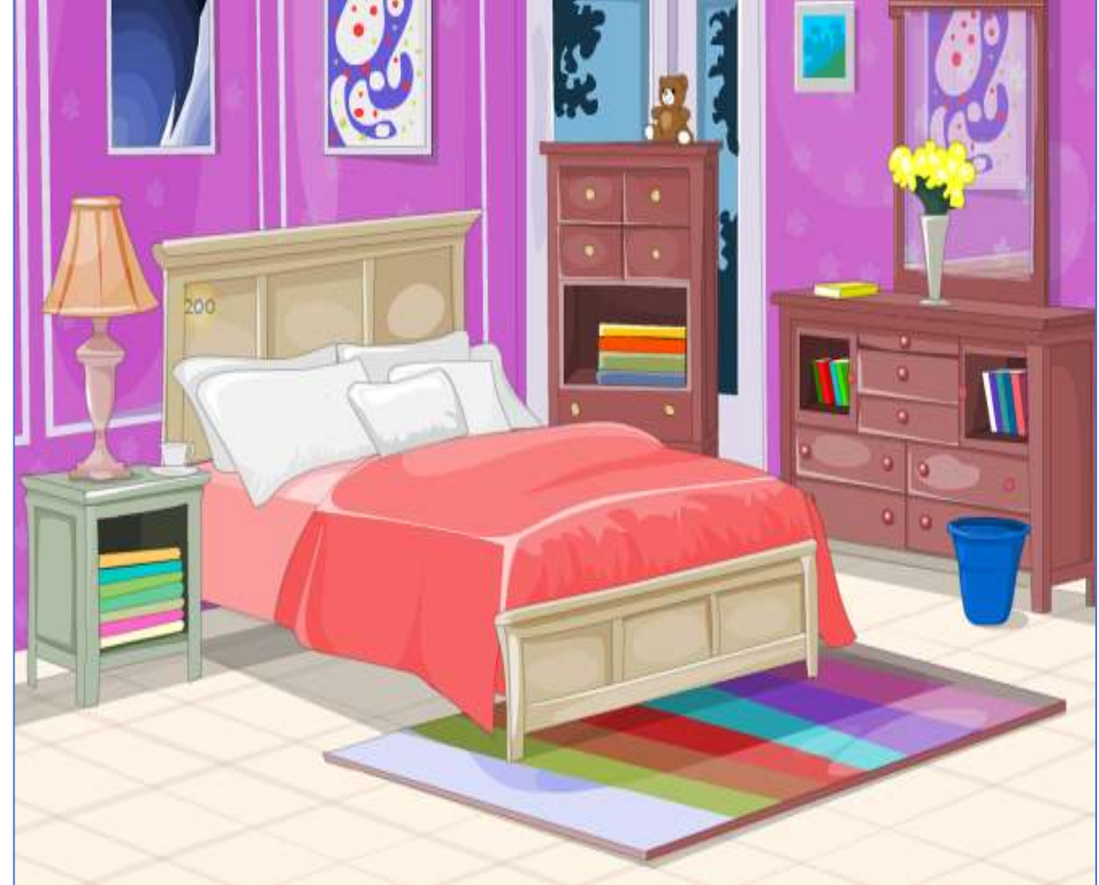
صورة ( 1 )