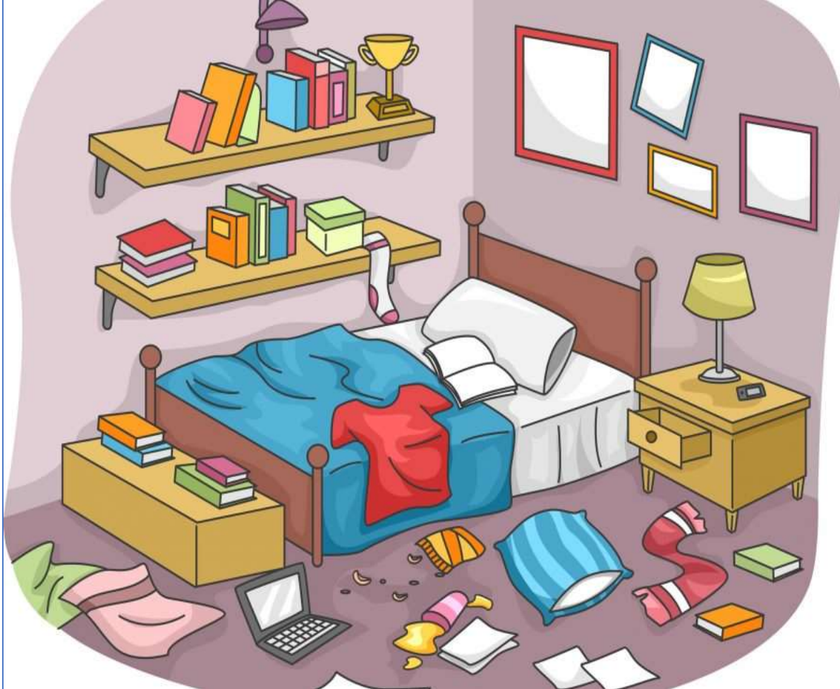
صورة ( 2 )