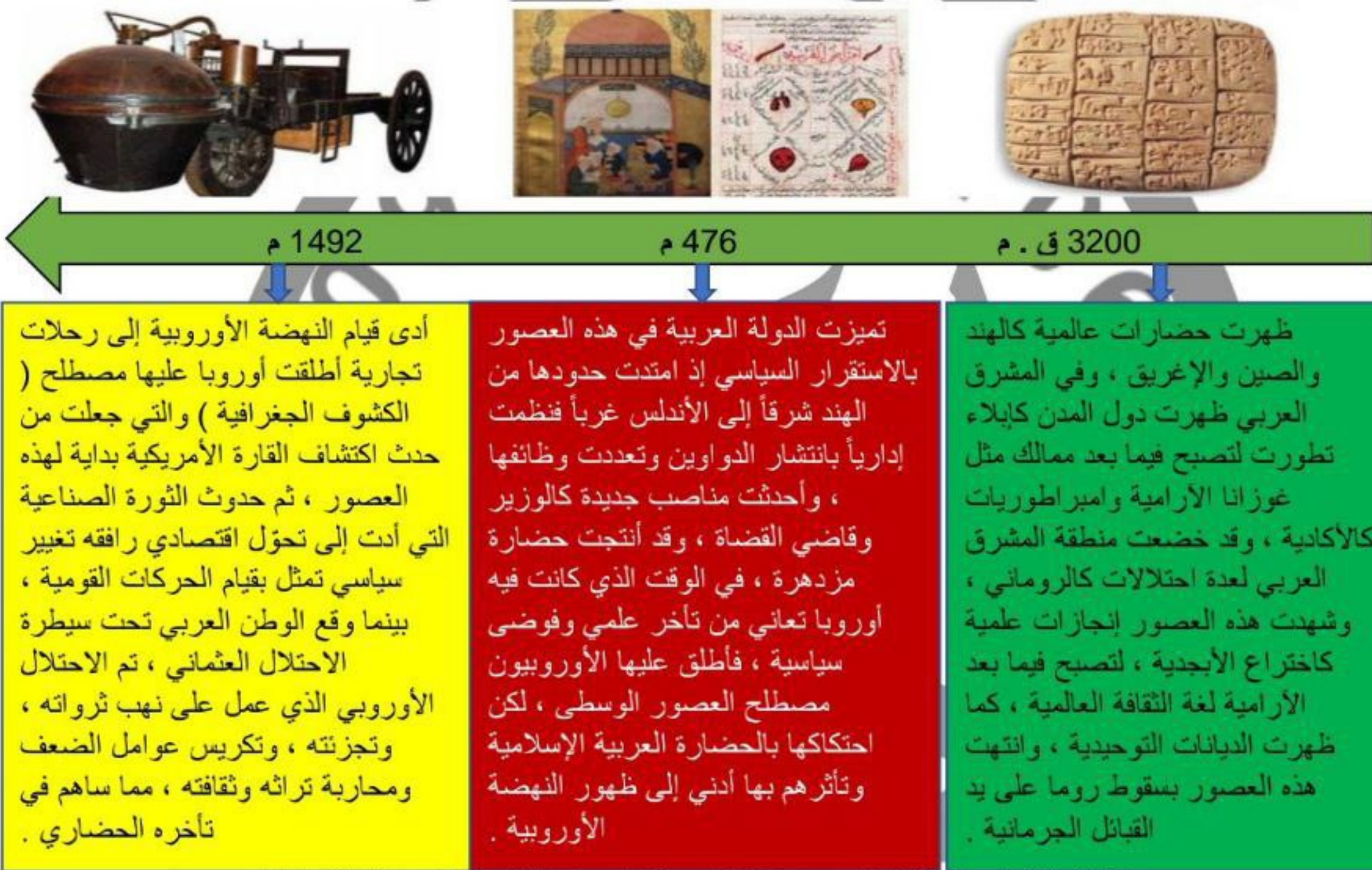
الشكل ( 2 ) : جدول زمني يعبر عن تقسيمات العصور التاريخية وسماتها في العالم .