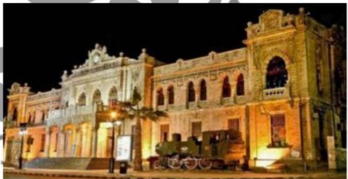
الشكل ( 3 ) : محطة الحجاز شيد المبنى معماري دمشق فيرناندو تحولت المحطة إلى متحف القطارات البخارية القديمة عام 2008 م احتفالاً بمرور مئة عام على تسيير الرحلة الأولى بين دمشق والمدينة المنورة .