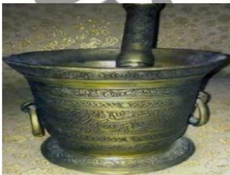
الشكل ( 5 ) : هاون نحاسي اشتهرت بصناعته مدينة دمشق .