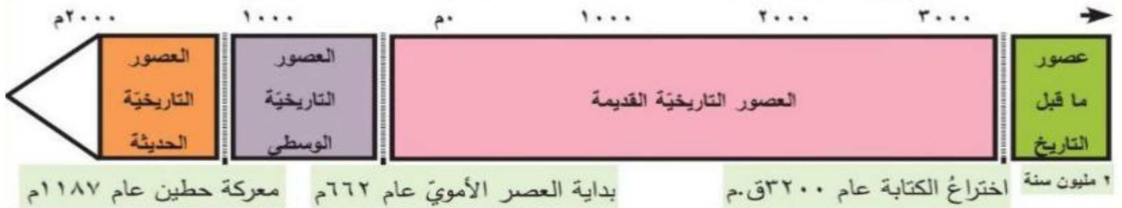
الشكل ( 1 ) : خط زمني لتقسيم العصور في الجمهورية العربية السورية.