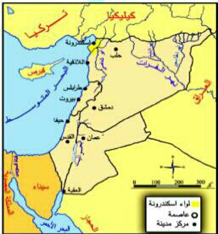
خريطة (٣): تحدد منطقة قناة السويس التي افتتحت عام ١٨٦٩ م، وقد ساهم في حفرها نحو مليون عامل مصري مات منهم أكثر من ١٢٠ ألف في أثناء عملية الحفر نتيجة الجوع والعطش والأوبئة. وموقع لواء اسكندرونة الذي سلخه الاحتلال الفرنسي عن الوطن الأم سورية عام ١٩٣٩ م.

أصبحت قناة السويس بعد افتتاحها عام ١٨٦٩ م محور الطرق التجارية بين الشرق والغرب، مما أثر على حلب ومنع عنها صادرات البلدان المجاورة لها، زاد الأمر سوءاً قطع الاحتلال الفرنسي عليها سبل التجارة مع شمال العراق وجنوب تركيا، وحرمانها من إطلالتها البحرية بسلخ لواء اسكندرونة مرفأها الطبيعي عام ١٩٣٩ م. على مرّ الزمن حافظت سورية عامة وحلب خاصة على مكانتها التجارية نظراً لموقعها الجغرافي بين الهند والبحر المتوسط، فحلب نقطة تواصل اقتصادي، فيها كل صناعات الشرق ومركز تجاري لبضائع الهند والعراق وطوروس، فبذل التجار الحلبيون جهودهم كي تحافظ مدينتهم على أهميتها التجارية، بتعميق العلاقات مع منطقة الجزيرة السورية التي أمّدت حلب بالمنتجات الزراعية، وتحوّلت حركة الاستيراد والتصدير إلى ميناءي اللاذقية وطرابلس.