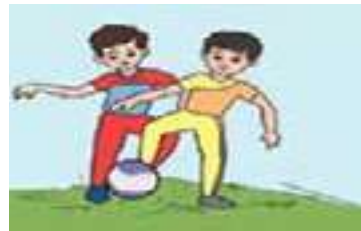
هما يلعبان بالكرة