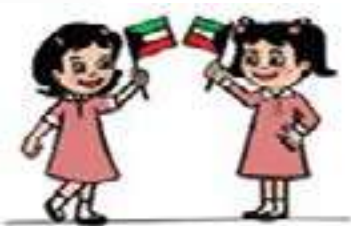
هما ترفعان الأعلام.