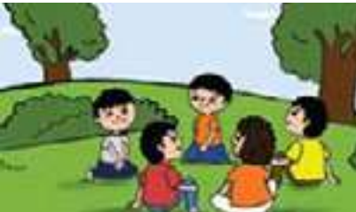
هم يجلسون في الحديقة