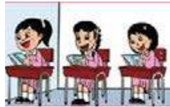
هنّ يدرسن بجد