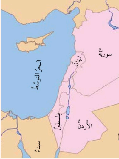
صورة 1 البصر الذي أقام عليه الفينيقيون مراكز تجارية هامة

بلاد الشام منطقة غنية بالتاريخ والحضارات وقامت على أرضها العديد من الحضارات ومنها الأراميون والفينيقيون والكنعانيون حيث اعتنى الكنعانيون بالزراعة نتيجة توافر المياه والتربة الخصبة وعرف عنهم كذلك اختراع الكتابة الأبجدية وكونوا لهم حروفًا لا يتعدى عددها اثنان وعشرين حرف أما الفينيقيون فهم شعب بحري ماهر ويعتبروا أول الشعوب البحرية في التاريخ عرفوا بتجارتهم وصناعة السفن وأسسوا مدنًا ساحلية وتفوقوا في صناعة الزجاج والنسيج الصوفي والقطني وصبغة الأقمشة بالأرجوان أما الأراميون فأسسوا لهم مملكات صغيرة متنافسة في المنطقة مثل مملكة دمشق ومملكة صوبا هذه المملكات لعبت دورًا مهمًا في تاريخ المنطقة كما ساهموا في تطوير الكتابة الآرامية والفنون والهندسة المعمارية كما اشتهرت بلاد الشام بموقعها الجغرافي الاستراتيجي الذي جعلها مركزًا للتجارة والتبادل الثقافي بين الشرق والغرب و كانت هذه المنطقة ملتقى للعديد من القوافل التجارية التي جلبت معها السلع والتقاليد من مختلف الحضارات المجاورة