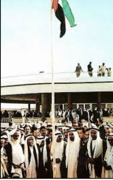
قصر الاتحاد الذي رفع فيه علم الإمارات لأول مرة عام 1971م

بادرت فكرة الاتحاد الإماراتي لدى حكامها أول مرة عام 1906 م ولكن لن تتم بسبب الظروف الاقتصادية والسيطرة البريطانية وبعد اكتشاف النفط عام 1958م في أبوظبي ازدهر الاقتصاد وبدأت الأحوال الاقتصادية المحلية في النهوض مقابل البريطانيين عزموا الانسحاب قبل الاتحاد بأربع سنوات فهذا ما أفسح الطريق لحكام إمارتي أبوظبي ودبي في إعادة فكرة الاتحاد وذلك في اجتماع السميح عرقوب السديرة عام 1968م والذي قام على اتحاد إماراتي أبوظبي ودبي فقط ووجه الشيخ زايد بن سلطان آل نهيان والشيخ راشد بن سعيد آل مكتوم نداءهما الأول إلى بقية حكام الإمارات المجاورة بالدعوة إلى الاتحاد حيث استجاب الحكام للنداء الأخوي وفي اجتماع دبي الأول ( الاجتماع التساعي ) في 25 فبراير 1968 م اجتمع قوى الاتحاد وأرادو تطويره كما اجتمع معهم بقية الإمارات المتصالحة بجانب قطر والبحرين لتصبح دولة قوية وقد أقر الاجتماع على إنشاء لجان عليا للأخذ والنظر في القرارات وغير أنه لأسباب وعوامل مختلفة قررت قطر والبحرين للانسحاب من الاتحاد وتكملة مسيرتهما منفردتين وفي اجتماع دبي الثاني في 10 يوليو 1971م أعلن فيه عن قيام دولة اتحادية باسم الإمارات العربية المتحدة و صدر فيها الدستور المؤقت وفي الثاني من ديسمبر بنفس العام أعلن رسمياً عم قيام دولة اتحادية ذات سيادة