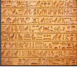
صورة 2 : اللغة المصرية

تمركزت في وادي النيل وهو وادٍ ضيقٍ يمتد من أسوان إلى رأس الدلتا بالقرب من القاهرة حيث المياه المتوفرة والأراضي الخصبة لذلك اهتم المصريون بتنشيط الزراعة في بلادهم وتنظيم الري فاستخدموا الشادوف وهو وسيلة لرفع الماء من النهر كما استخدموا وسائل متنوعة مثل المنجل والمحراث للزراعة وأنتجت مصر العديد من المحاصيل مثل القمح والعب و الكتان واهتموا كذلك بعلوم الفلك والتقويم التي ساعدتهم على تحديد مواعيد الزراعة والحصاد بدقة مما أسهم في تحسين الإنتاجية وزيادة الثروات الزراعية وجمعوا الأشهر في ثلاث فصول ( الفيضان - البذر - الحصاد ) وأهم ما يميز الحضارة المصرية هو تحرير النصوص الدينية باستخدام اللغة الهيروغليفية المؤلفة من الرسوم والأدوات والأعمال الفنية ولقد كانت هذه اللغة وسيلة للتعبير عن العمق الروحي والفكري للمصريين القدماء وعكست مدى تطورهم في مجالات متنوعة بالإضافة إلى ذلك كانت الهندسة المعمارية والفنون من العناصر البارزة في الحضارة المصرية فقد أبدع المصريون في بناء الأهرامات والمعابد التي لازالت تشهد على عظمتهم وابتكارهم فهذه المنشآت لم تكن مجرد مباني بل كانت تمثل رموزاً دينية وثقافية تعكس المعتقدات والقيم السائدة في تلك الفترة