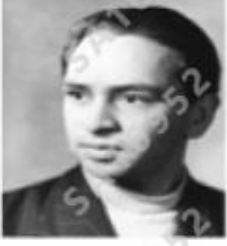
ملك راج أناند

أولاً : اقرأ النصَّ السردِيَّ قراءة معمقة، ثمَّ أجبْ عَنِ الأَسْئَلَةِ الَّتِي تَلِيهِ: