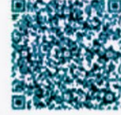
دليل المستخدم للموظفين