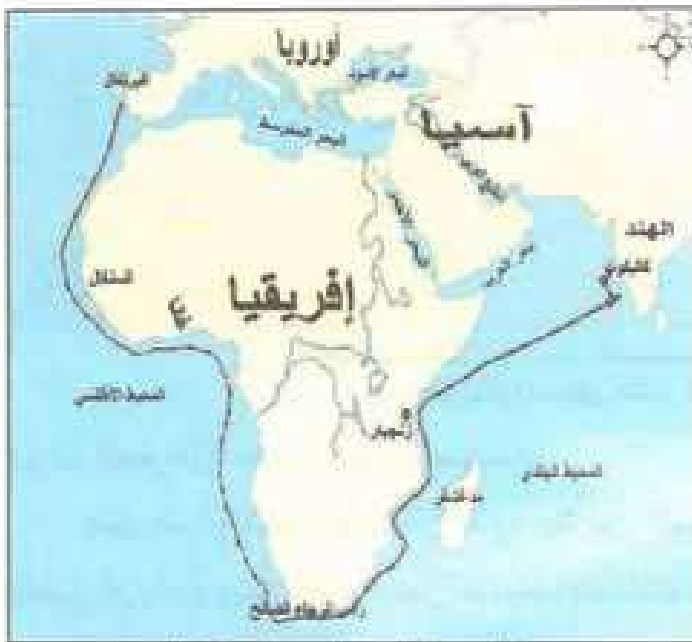
الخريطة (٢) خط سير رحلة فاسكو دي غاما

١- الكشوف البرتغالية: شجع الأمير هنري الملاح Henry ١٣٩٤-١٤٦٠م ابن ملك البرتغال الملاحين في البرتغال على اكتشاف سواحل إفريقيا الغربية، بعد إقامته مرصداً