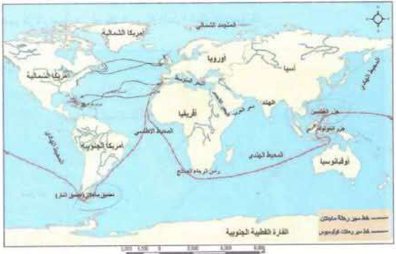
الخريطة (٣) مسار رحلة كولومبس خط سير رحلة ماجلان حول العالم

قام كولومبس بعد ذلك بثلاث رحلات وصل فيها إلى جزر الأنتيل الصغرى وإلى أمريكا الوسطى وحاذى الشواطئ الشمالية لأمريكا الجنوبية، ولكنه لم يحد بالذهب والتوابل، فأوقف الأسبان هذه الرحلات، ومات كولومبس عام ١٥٠٦م من دون أن يعلم أنه قد