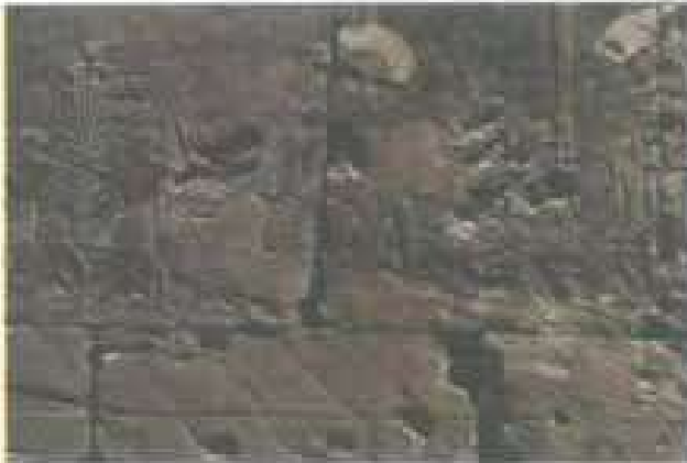
الشال (٢) نقي إحدى سفن بعثة حتشبسوت إلى بلاد البونت

حصل تجارها على الكثير من المعلومات عن البلاد البعيدة، من خلال أسفارهم، ومنذ عام ٢٥٠٠ ق.م بدأت الرحلات الاستكشافية التجارية تنتقل جنوباً حتى المحيط الهندي، وغرباً إلى البحر المتوسط.