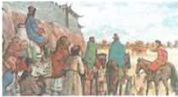
الاشغال (٣) ماركو بولو يبتدئ في الصورة في أعلى اليمين

فتموها، أصبح الأوروبيون مزودين بجميع المؤهلات البحرية اللازمة لتحقيق مشروعاتهم الاستكشافية منذ القرن الخامس عشر الميلادي.