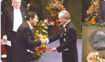
العالم المصرى أحمد زويل يتسلم جائزة نوبل