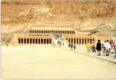
معبد الملكة حتشبسوت بالدير البحرى