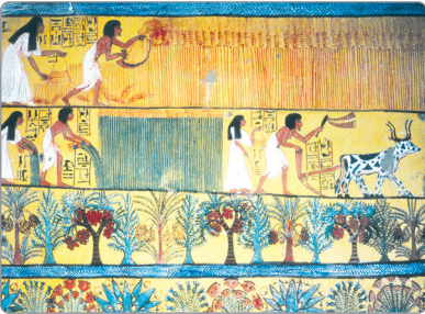
صورة توضح اهتمام المصرى القديم بالزراعة