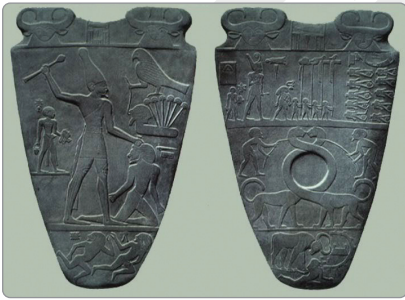
صلاية الملك نعرمر