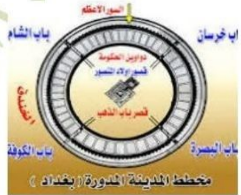
( مخطط لمدينة بغداد المدورة )