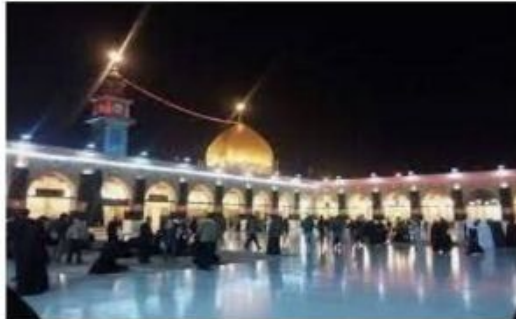
مسجد الكوفة ليلاً

ج/ عندما إتخذها الخليفة الراشدي الرابع الإمام علي (عليه السلام ) مقراً له سنة ٤٣٦ هـ .