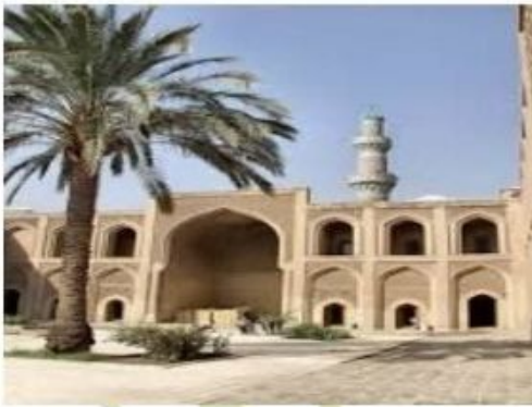
( المدرسة المستنصرية )