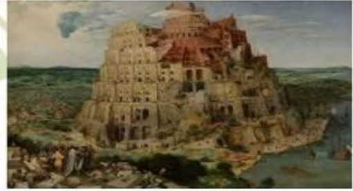
( برج بابل )