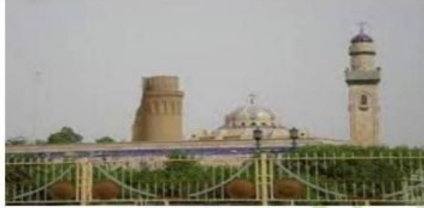
(ثاني مسجد في الإسلام بمدينة البصرة)

ج/ تقع مدينة البصرة على رأس الخليج العربي .