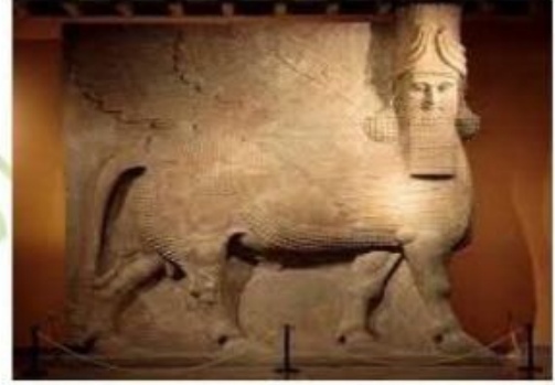
( الثور المجنح )

الخبير في كل شيء كان مبتدئاً في يوماً ما