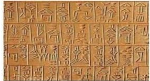
( لوح طيني )