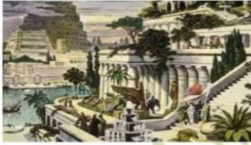
( الجنائن المعلقة )

٣- اشتهرت الحضارة البابلية بازدهار علوم الفلك والرياضيات والنحت وصناعة الفخار .