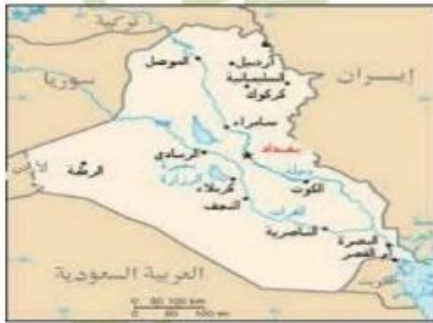
( خريطة العراق للموارد المائية )

٤- الاجواء (السماء) : يشمل ما فوق تلك الأراضي والمياه من أجواء (السماء) . عرف