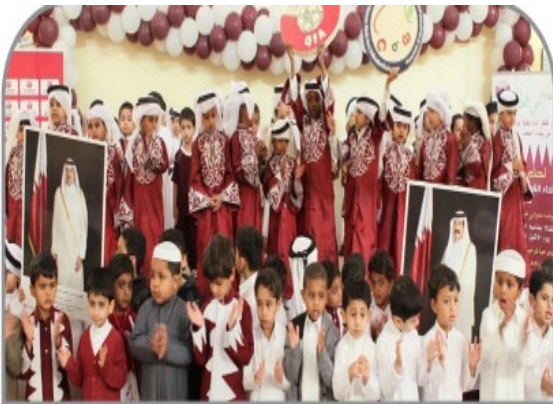
اختفالاتُ الطَّلَابِ بِالنُّيُومِ الْوَطَنِيِّ